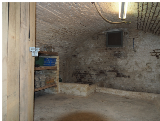
Kelder van "ons" huis op de Houtstraat