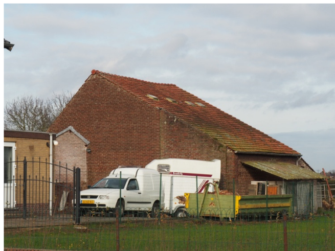
Boerderij schuur van Vaessen Houtstrt 115.