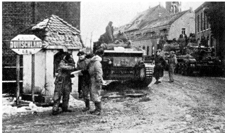
Tanks bij het kruispunt Pey

Engelse tanks staan was een bericht. Twee tanks rijden op en neer en blijven vuren. In de namiddag rijden de tanks richting Lilbosch. De soldaten zijn verdwenen en alles is rustig tot er plotseling een fel aanhoudend pantsergeschut vanaf Lilbosch te horen is. De toren van Pey wordt van de kerk geschoten. We hebben een rustige nacht gehad Met een snee brood en havermout als avondmaal.