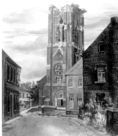
De kerktoren werd door de Britten van de kerk in Pey geschoten omdat er een uitkijkpost van de Duitsers inzat